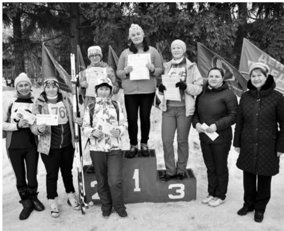
Поклонники спорта получили заслуженные награды