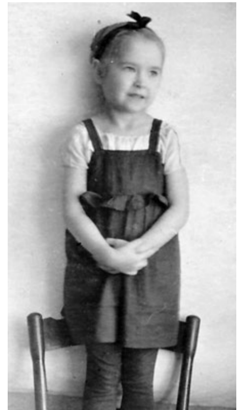
Аленушка. 1939 год

Однажды, возвращаясь из города после посещения родных, мы с мамой опоздали на последний поезд. Следующий был только утром. По законам военного времени маме за опоздание грозила тюрьма.