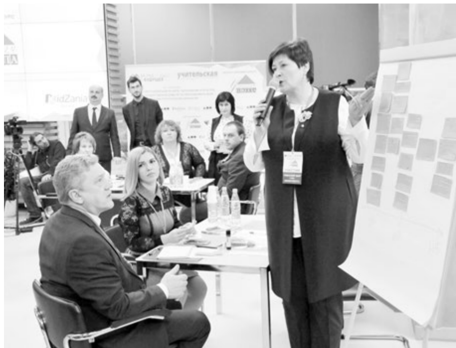
Испытание «Проектный офис»

Цель конкурсного испытания «Проектный офис» - демонстрация культуры проектирования в образовании, видения проблем на пути к развитию у школьников