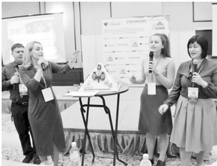
Свой проект представляет Кантемировский лицей Воронежской области

Конкурс «Успешная школа» проводят издательский дом «Учительская газета» и благотворительный фонд Сбербанка «Вклад в будущее» при поддержке Комитета Государственной Думы РФ по образованию и науке, Комитета Совета Федерации по науке, образованию и культуре и Агентства стратегических инициатив.